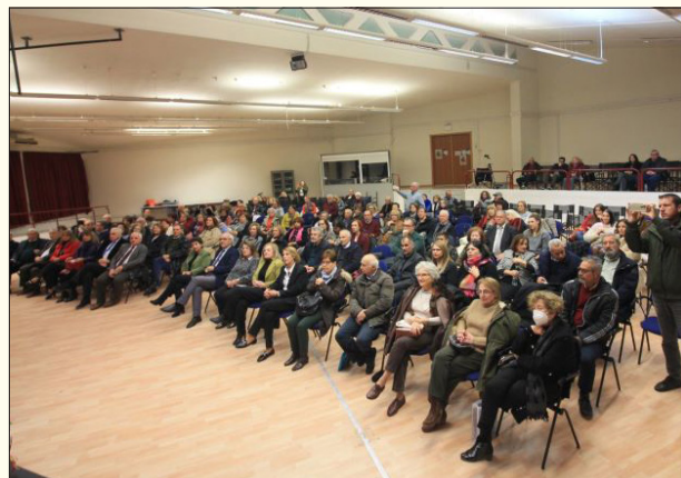
Το πολυπληθές ακροατήριο