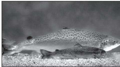
Εικόνα 1. Φυσιολογικός Σολωμός 18 μηνών (κάτω) και Γενετικά Τροποποιημένος Σολωμός ίδιας ηλικίας

Αντίθετα, με τη ΓΜ η έκταση και η ένταση των γενετικών μεταβολών μπορούν να αυξηθούν δραστικά, αφού μπορούμε «να κόψουμε και να ράψουμε» γενετικό υλικό από δύο ή περισσότερα πολύ διαφορετικά (βλ. ασύμβατα) είδη, για παραγωγή νέων, παρά φύση φυτών ή ζώων τύπου « Frankenstein » (βλ. εικ. 1 και 2). Με τον τρόπο αυτό, γονίδια από ένα επίπεδο ζωής (π.χ. ψάρι) μπορούν να εισαχθούν σε κάποιο άλλο επίπεδο (π.χ. ντομάτα). Μιλάμε