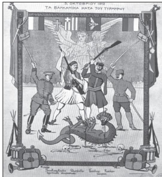
Γελοιογραφία της εποχής του «Βαλκανικού συνασπισμού» εναντίον της Τουρκίας

Την επομένη, 2 Νοεμβρίου 1912, τα πολεμικά