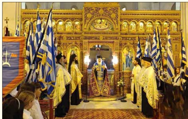
Δοξολογία στον Ι.Ν. Αγίου Γεωργίου στην Ποτίδαια