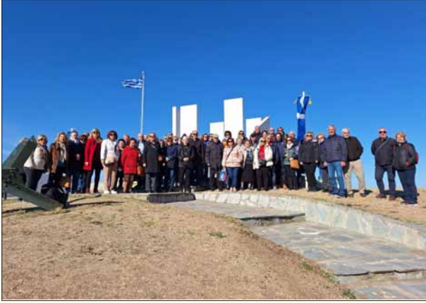
Τμήμα εκδρομέων στο μνημείο του Οχυρού