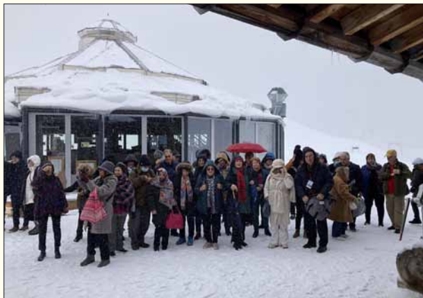
Στην κορυφή των Βαυαρικών Άλπεων