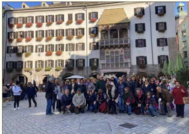
Στην πλατεία του Ίνσμπρουκ