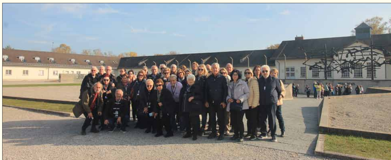
Στο Στρατόπεδο Νταχάου