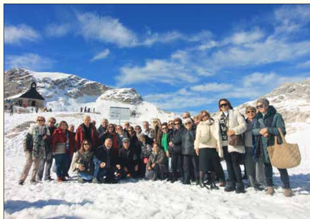
Στην κορυφή των Βαυαρικών Άλπεων