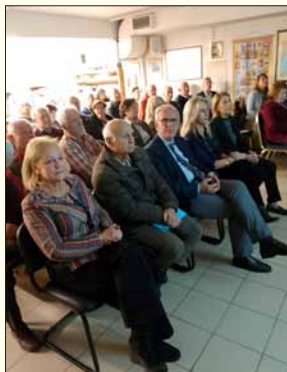
Τμήμα του ακροατηρίου