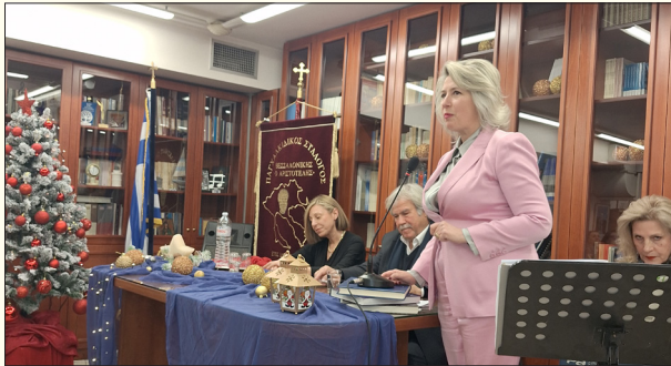
Χαιρετισμός από την Αντιπεριφερειάρχη Κατερίνα Ζωγράφου