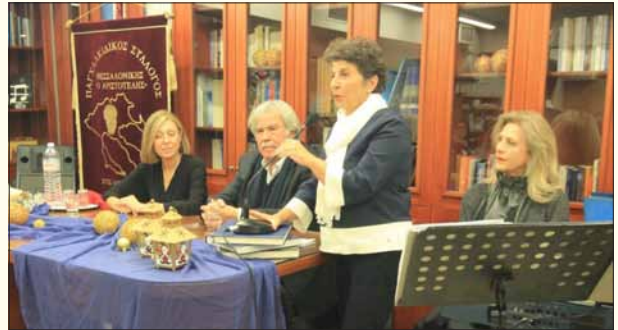
Χαιρετισμός από την Βουλευτή Χαλκιδικής Κυριακή Μάλαμα