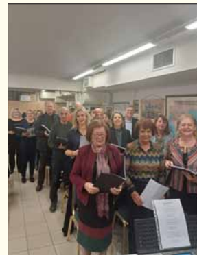
Η χορωδία μας