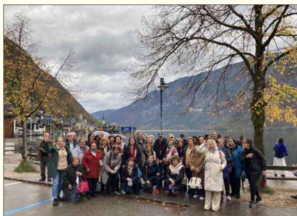
Στην λίμνη Χάλστατ