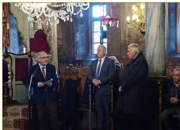
Ο Πρόεδρος στην προσφώνησή του