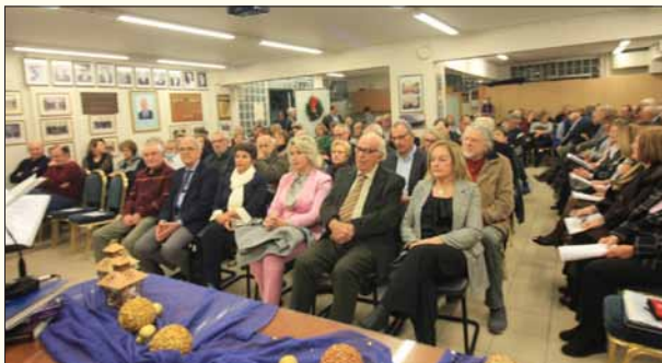
Το πολυπληθές ακροατήριο και η χορωδία του Παγκυκδικικού Συλλόγου