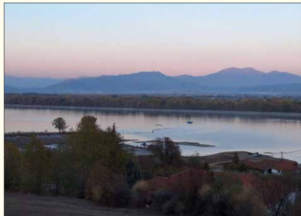
Τμήμα της λίμνης Κερκίνης