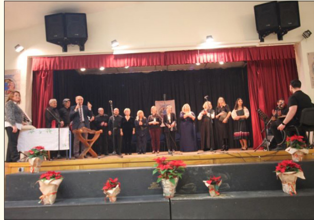
Ευχαριστίες στο τέλος της εκδήλωσης από τον πρόεδρο του Π.Σ.