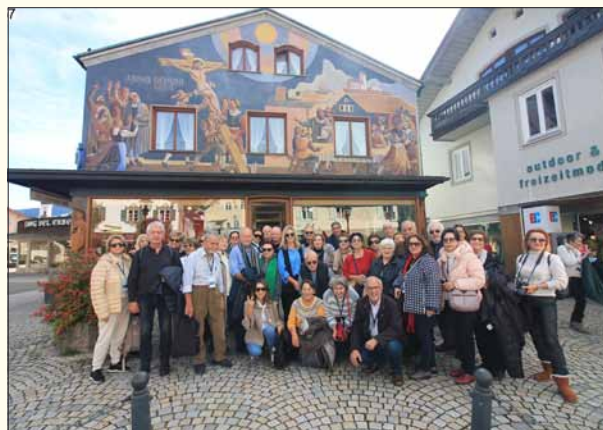
Στο ξακουστό Ομπερμαγκάου