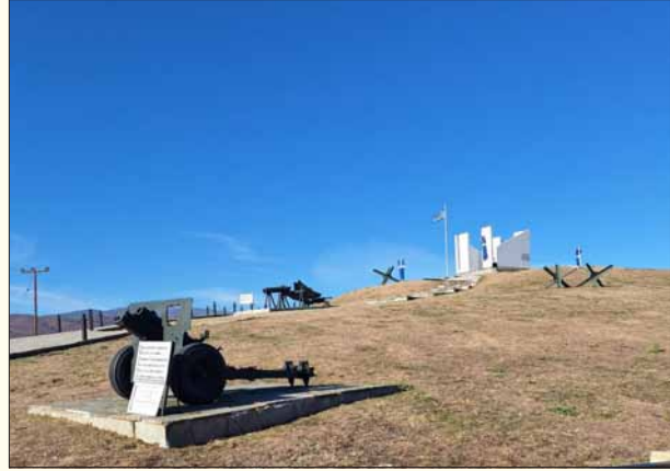
Άποψη του μνημείου