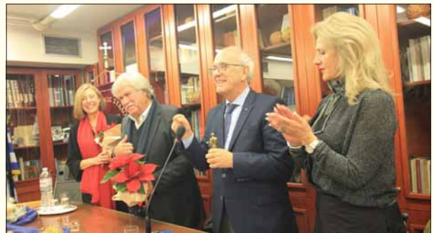
Απονομή αναμνηστικών στους ομιλήτες από τον Πρόεδρο του Π.Σ.