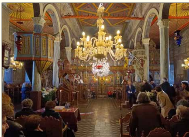
Ο Ιερός Ναός Ευαγγελισμού της Θεοτόκου στα Βράσταμα