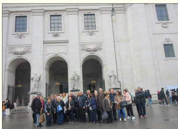
Στον Καθεδρικό Ναό στο Σάλτσμπουργκ