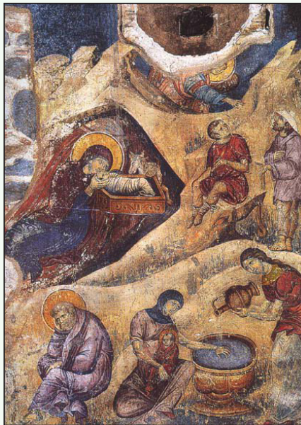
(Ἡ γέννηση τοῦ Χριστοῦ, Μανουὴλ Πανσέληνος, τοιχογραφία ἀπὸ τὸ Πρωτάτο Ἁγίου Ὁρους, 13ος αἰ.)

Τὸ παιδί αὐτὸ τὸ γέννησε ἡ Παναγία σέ μιὰ σπηλιά. Τὸ σπαργάνωσε καὶ τὸ ξάπλωσε σ' ἓνα παχνί. Ἔτσι ὁ