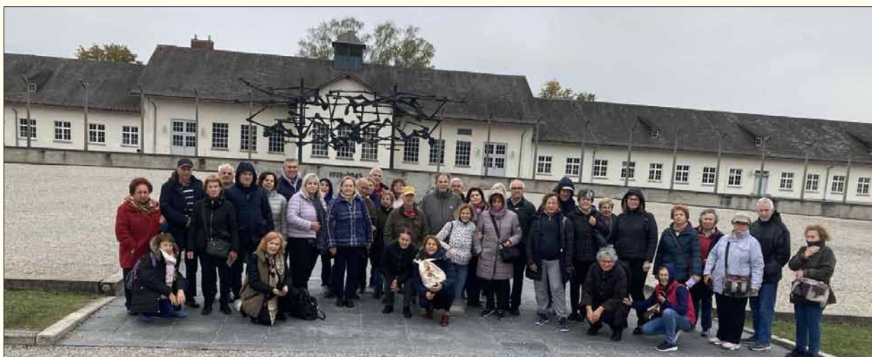
Στο Στρατόπεδο Νταχάου