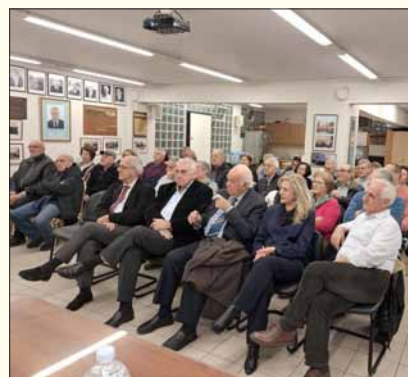
Τμήμα του ακροατηρίου