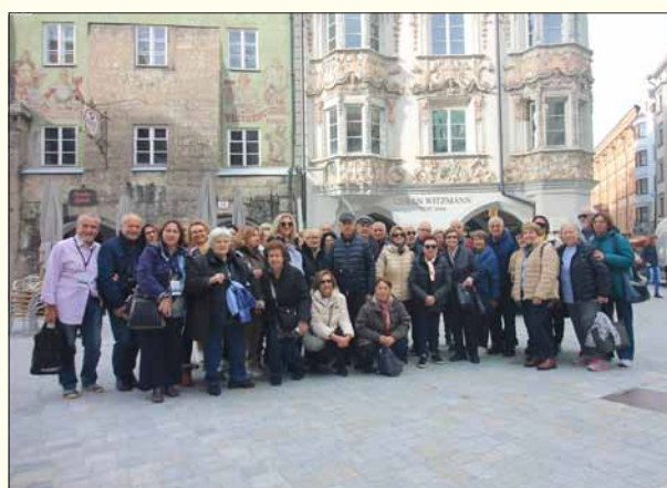
Στην πλατεία του Ίνσμπρουκ