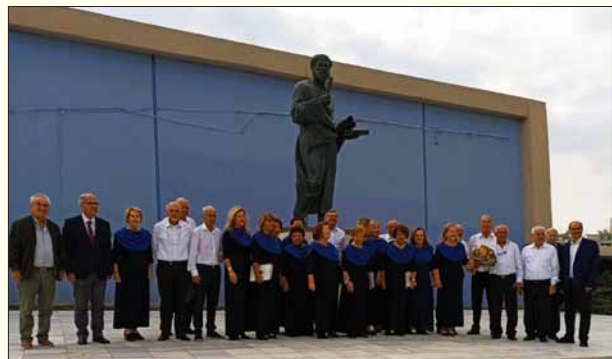
Στο άγαλμα του Αριστοτέλη