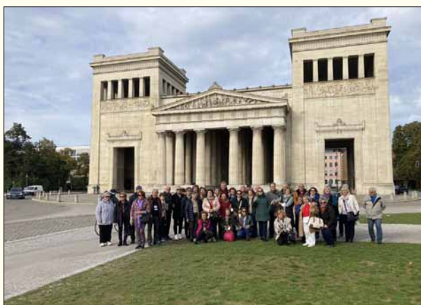
Προπύλαια: Στη Βασιλική πλατεία του Μονάχου