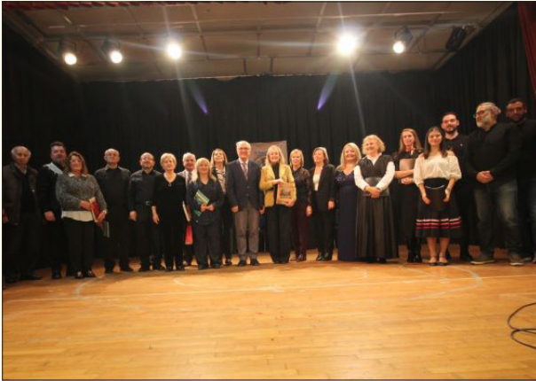
Αναμνηστική φωτογραφία μελών του Δ.Σ. με τους συντελεστές της εκδήλωσης