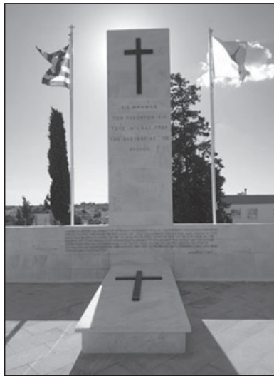
Το Ηρώο στο στρατιωτικό κοιμητήριο της Λευκωσίας στη μνήμη των πεσόντων κατά την τουρκική εισβολή το 1974

Από τις μαρτυρίες των διασωθέντων στρατιωτικών, αποκαλύπτεται