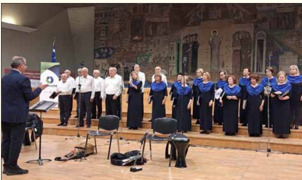
Στην αίθουσα τελετών του ΑΠΘ