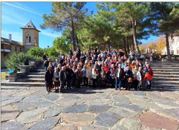
Στην Ιερά Μονή Τιμίου Προδρόμου στο Ακριτοχώρι