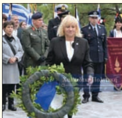
Από την Δήμαρχο Κασσανδρείας κα. Αν. Χαλκιά